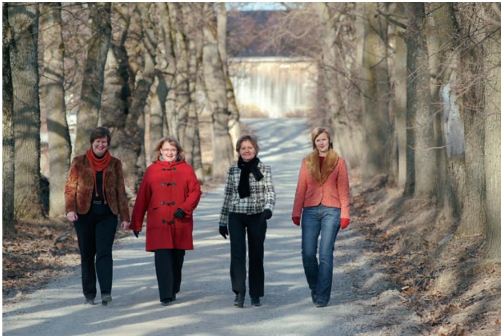
Prosjektet jobber for å tilby et felles bibliotektilbud til alle som bor i de tre kommunene. Sammen er vi mer enn enkeltdelene.

«Et mål for prosjektet er å gjøre det mulig for den enkelte bruker å kunne benytte sitt bibliotek uten hjelp fra personalet. Både fordi noen brukere vil ha det slik og fordi personalet da vil få bedre tid til de brukerne som faktisk ønsker og trenger hjelp.»